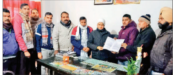
कुरुक्षेत्र। ज्ञापन सौंपते कर्मचारी।