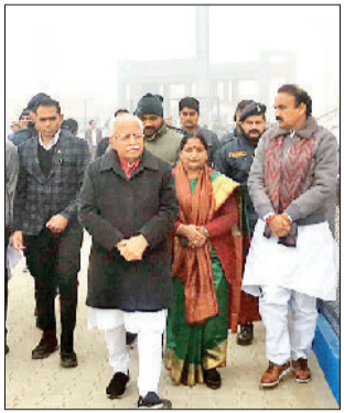
करनाल। मुख्यमंत्री मनोहर लाल अपने करनाल प्रवास के दौरान रविवार को कैलाश गांव में बने राष्ट्रीय स्तर के हॉकी स्टेडियम का निरीक्षण करते हुए व हॉकी खिलाड़ियों के साथ।