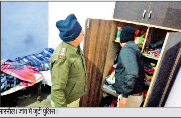
नारनौल। जांव में जुटी पुलिस।