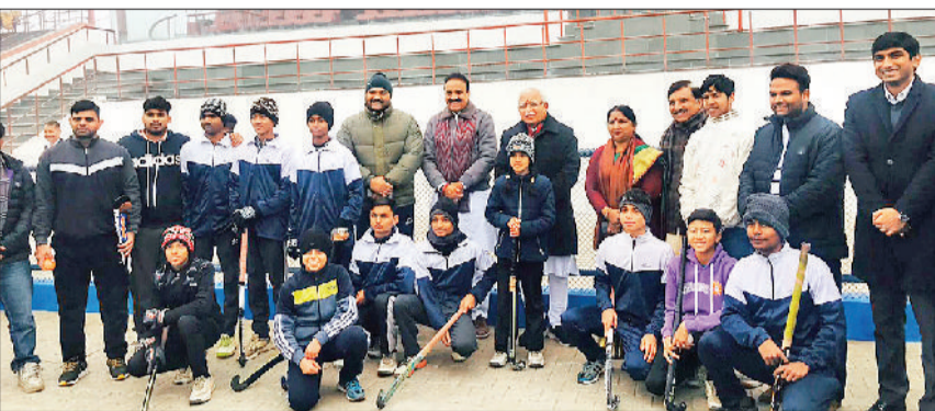
करनाल। मुख्यमंत्री मनोहर लाल अपने करनाल प्रवास के दौरान रविवार को कैलाश गांव में बने राष्ट्रीय स्तर के हॉकी स्टेडियम का निरीक्षण करते हुए व हॉकी खिलाड़ियों के साथ।

लगाभूग पूरा हो चुका है। जल्द ही यह जनता को समर्पित होगा। उन्होंने बताया कि यह हॉकी स्टेडियम इंटरनेशनल फेडरेशन ऑफ हॉकी के मानकों के अनुसार बनाया गया है। इसके निर्माण पर करीब 18 करोड़ 27 लाख रुपये की राशि खर्च हुई है और यह स्टेडियम साढ़े 6 एकड़ भूमि में बनकर तैयार हुआ है।