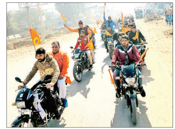
महेन्द्रगढ़। भगवा यात्रा निकालते हुए।