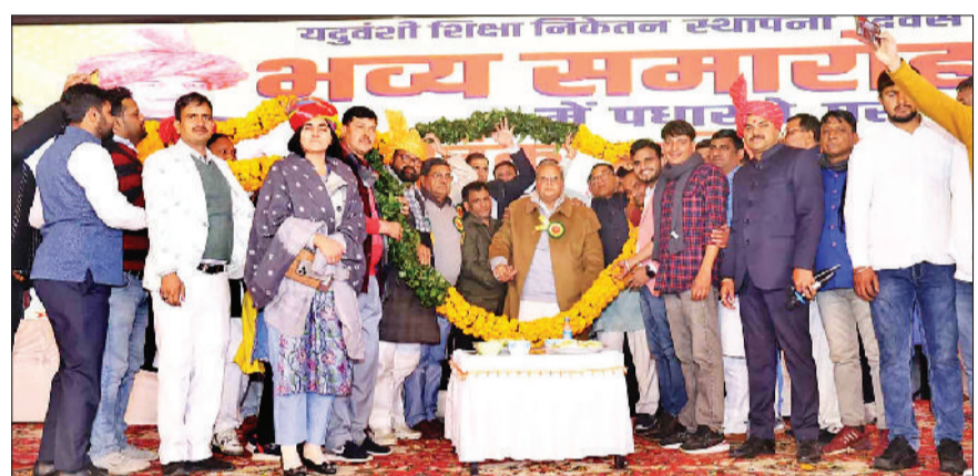
महेन्द्रगढ़। चरखी दादरी में आयोजित कार्यक्रम में अतिथि का बड़ी माला पहनाकर स्वागत करते हुए।