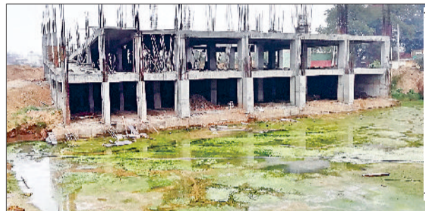
नारनौल जिले में अस्पताल में बनाया जा रहा नया भवन।

गिरता रहता है तथा छत भी टपकती रहती है। इसी कारण नारनौल में नए अस्पताल भवन की जरूरत महसूस की जा रही थी, जिसके चलते अस्पताल के लिए प्रदेश बिल्डिंग निर्माण में लोहे के सरिये की कमी आई गई है। इस कारण करीब एक माह से अस्पताल के नए भवन का निर्माण रूका हुआ है। बार-बार निर्माण में रूकावट आने से अस्पताल निर्माण में देरी हो रही है।